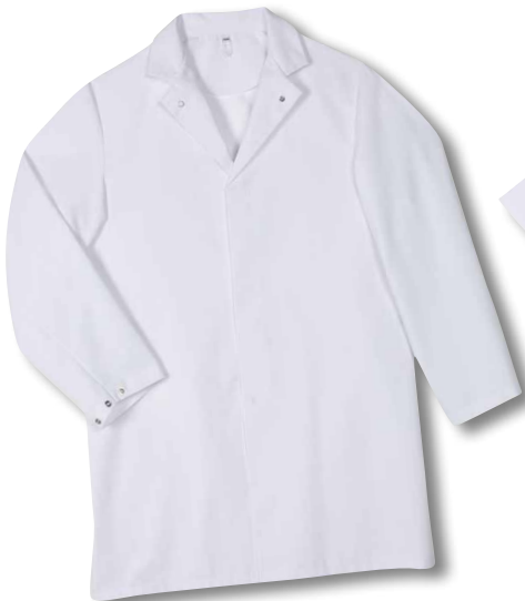
Damen-Kittel Artikel-Nr.: 2407/001

Revers-Umlegekragen • verstellbare Ärmelweite • Doppelgrößen