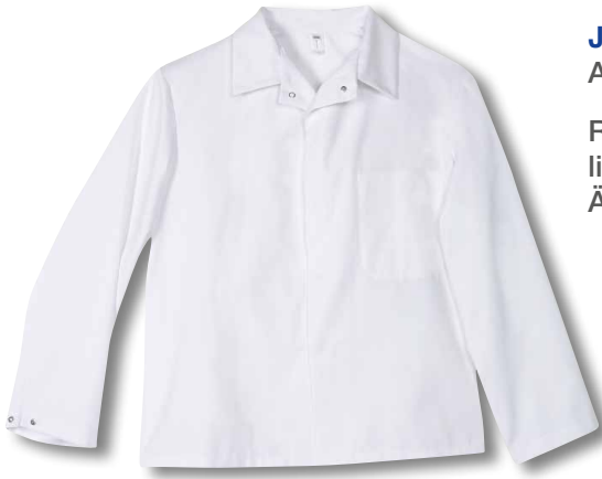
Jacke Artikel-Nr.: 2401/001

Revers-Umlegekragen • eine innenliegende Brusttasche • verstellbare Ärmelweite • Doppelgrößen